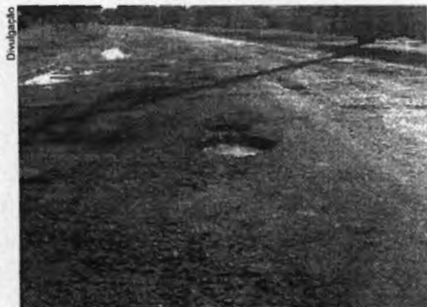
Decisão responsabiliza a administração pública pela existência de buracos e colocar a população em risco de vida, danos físicos e prejuízos materiais